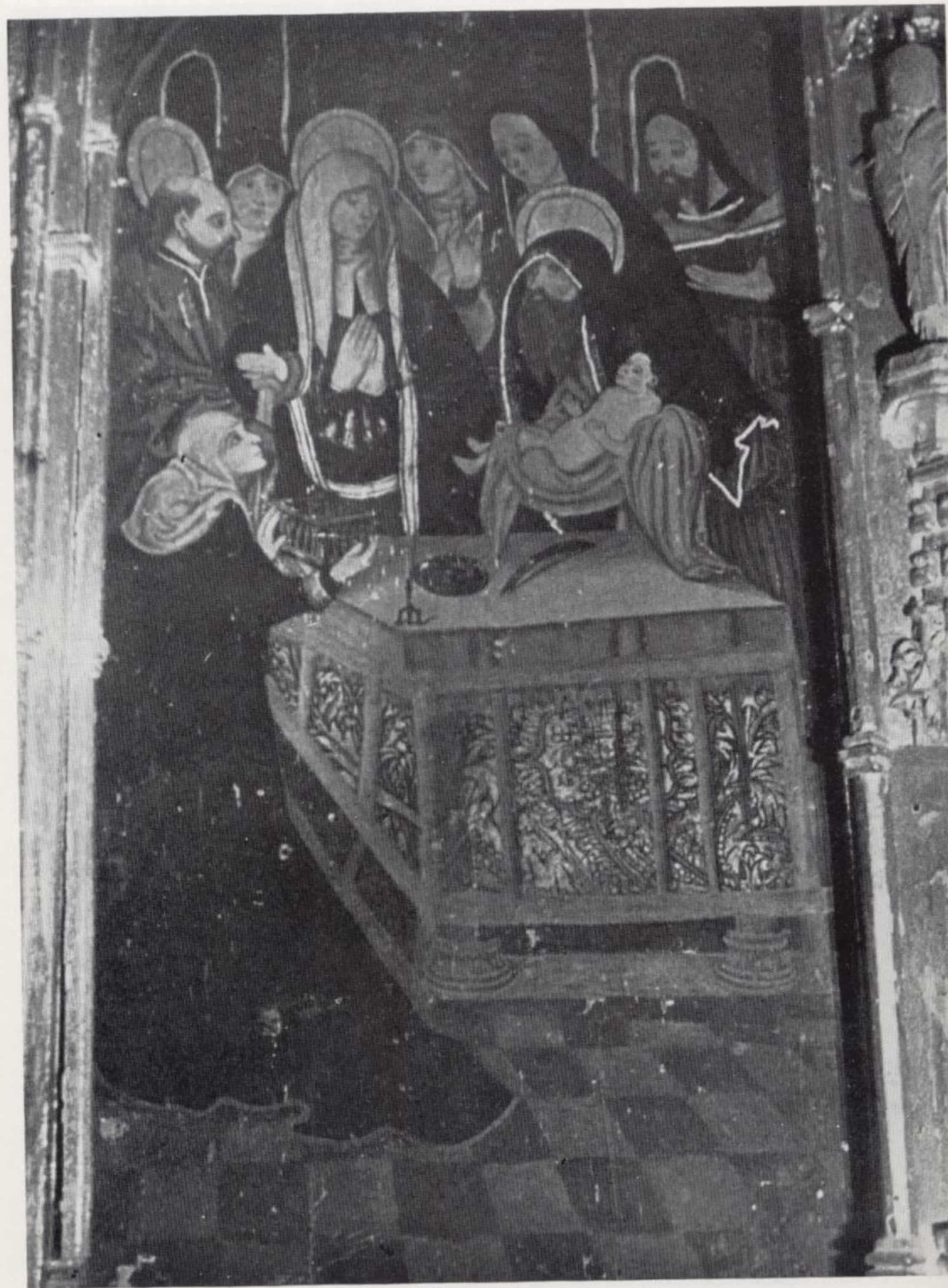
Lámina II.—Pormenor del Retablo de Calzadilla de los Barros.