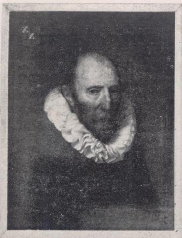
M. van Mierevelt.—Willem de Baviera.—Retrato IX