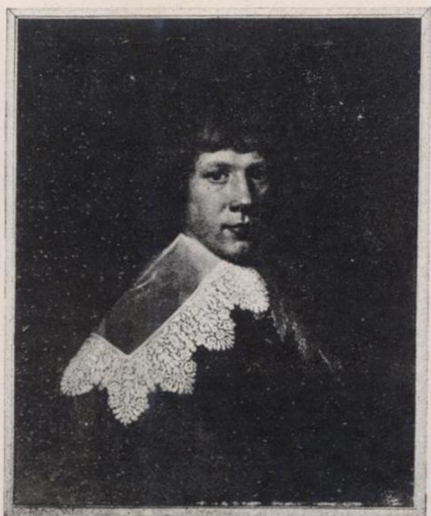
G. Honthorst.—J. Baptista van Aerssen.—Retrato V