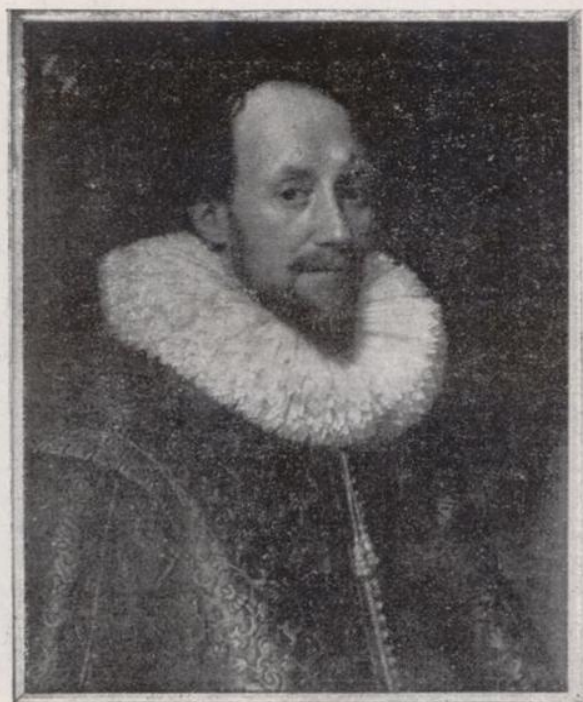
M. van Mierevelt.—J. de Baviera.—Retrato XI