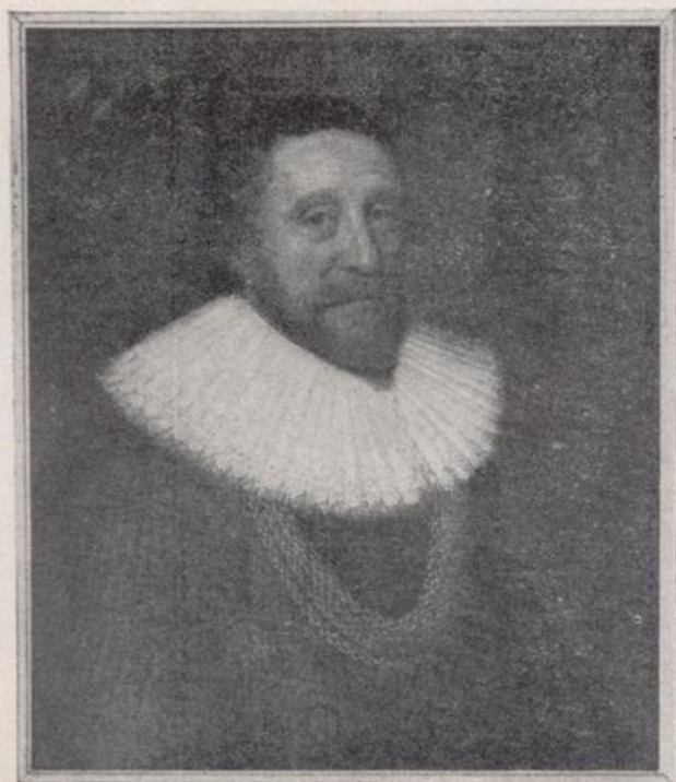
M. van Mierevelt.—Albrecht de Baviera.—Retrato VII