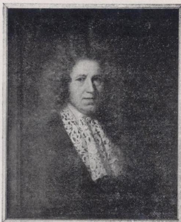
G. Schalcken. —C. barón van Aerssen.—Retrato XVII