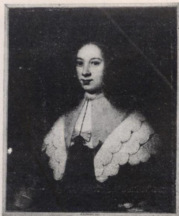
G. Honthorst.—María Hack.—Retrato VI