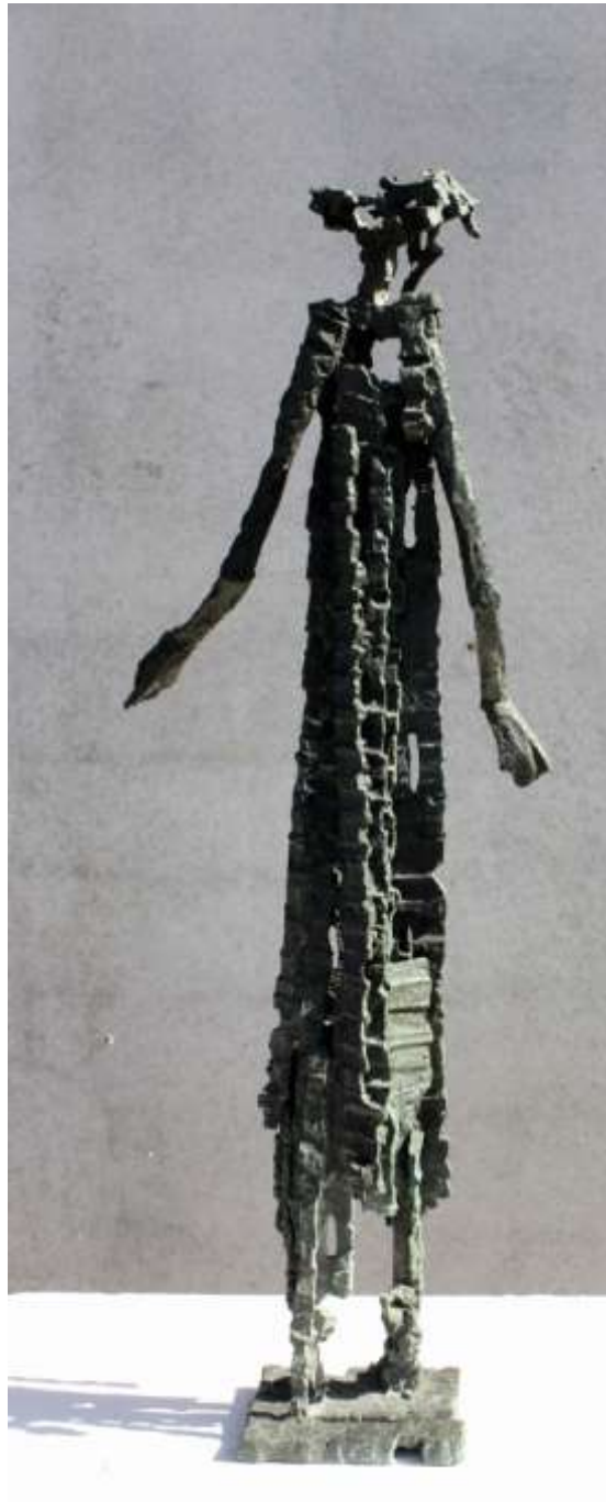
Balbino Montiano Benítez, "Diógenes de Sinope". 115 x 40 x 30 cm. Bronce.