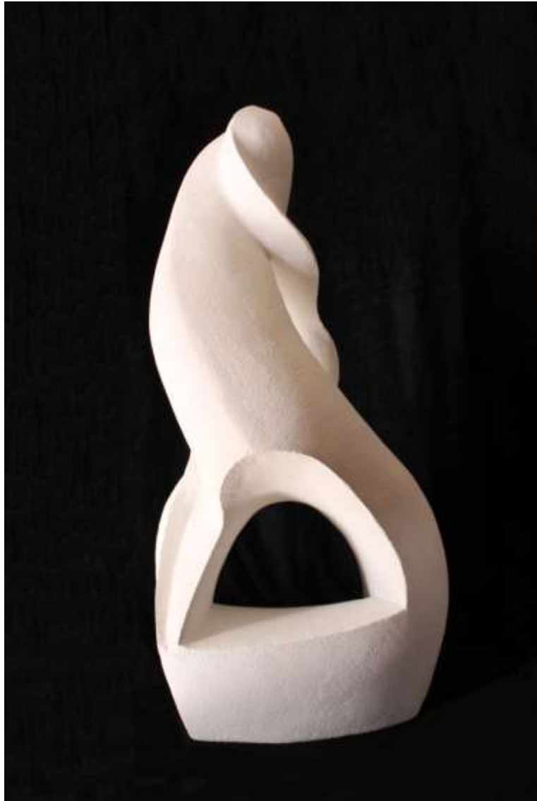
Manuela Gómez Soria, "Tango". 90 x 45 x 40 cm. Txt