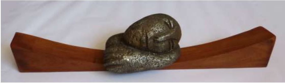
Mika Murakami, "E somno". 15 x 73 x 15 cm. Aluminio y madera