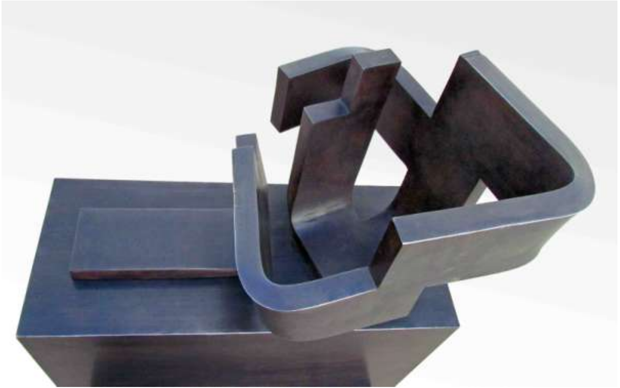
Carlos Albert, "Guadalquivir". 2014. 55 x 60 x 85 cm. Hierro forjado.