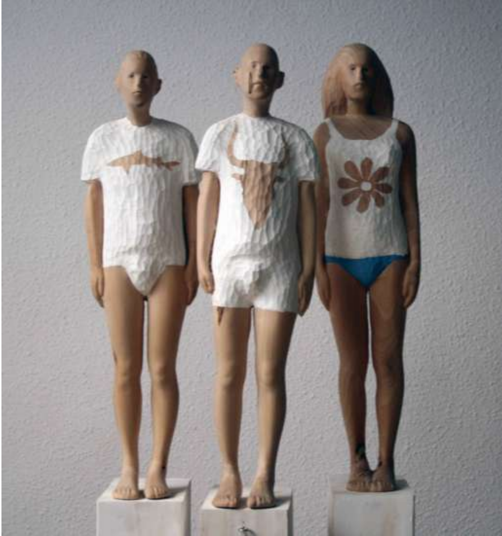
Antonio Samo Terrasa, "Naturaleza humana". 74 x 41 x 28 cm. Madera.