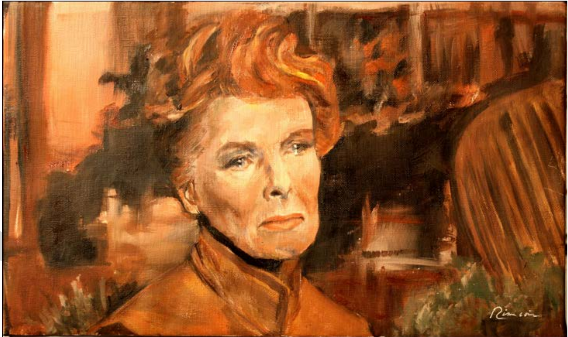
Katharine Hepburn "Adivina quien viene esta noche" (30x75) Óleo sobre lienzo